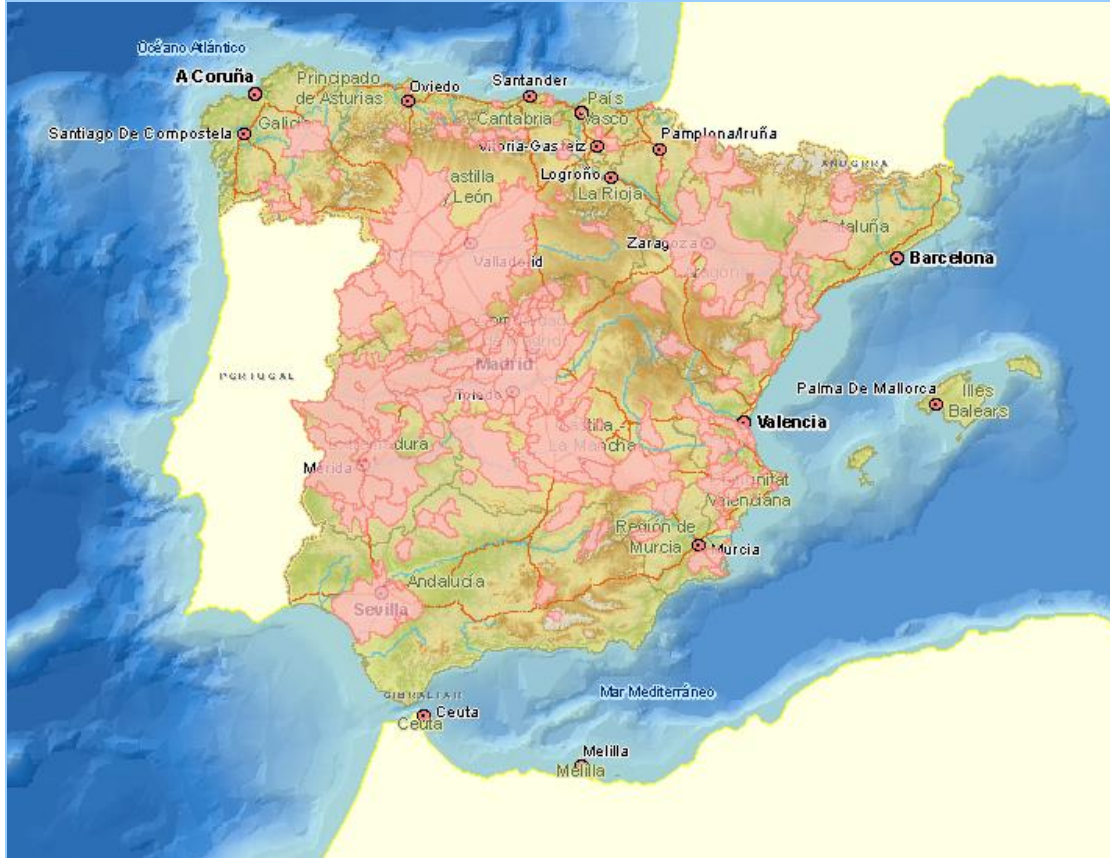
Imagen general del servicio

La información cartográfica que se puede visualizar en este servicio es la siguiente: