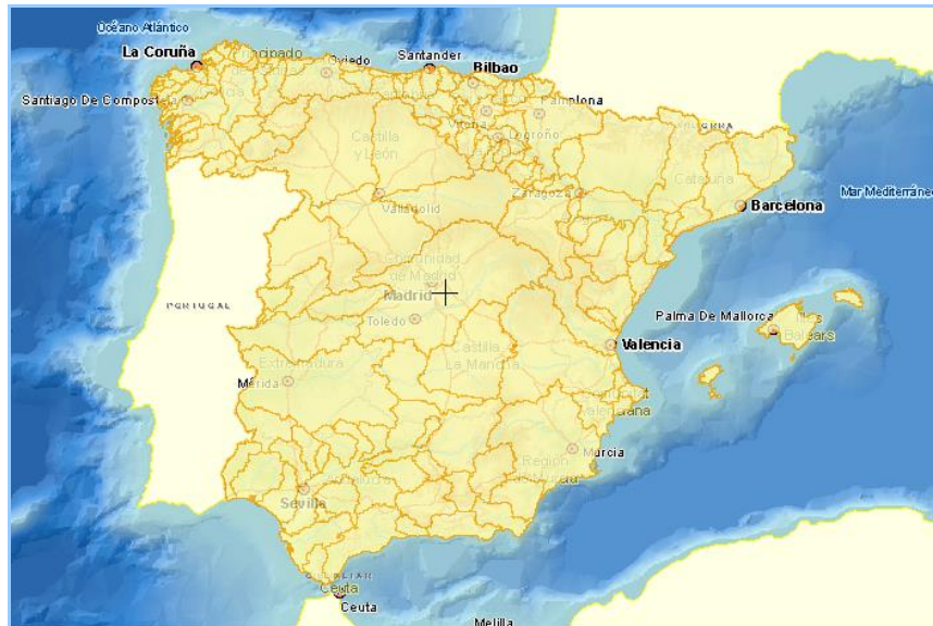
Imagen general del servicio

La información cartográfica que se puede visualizar en este servicio es la siguiente: