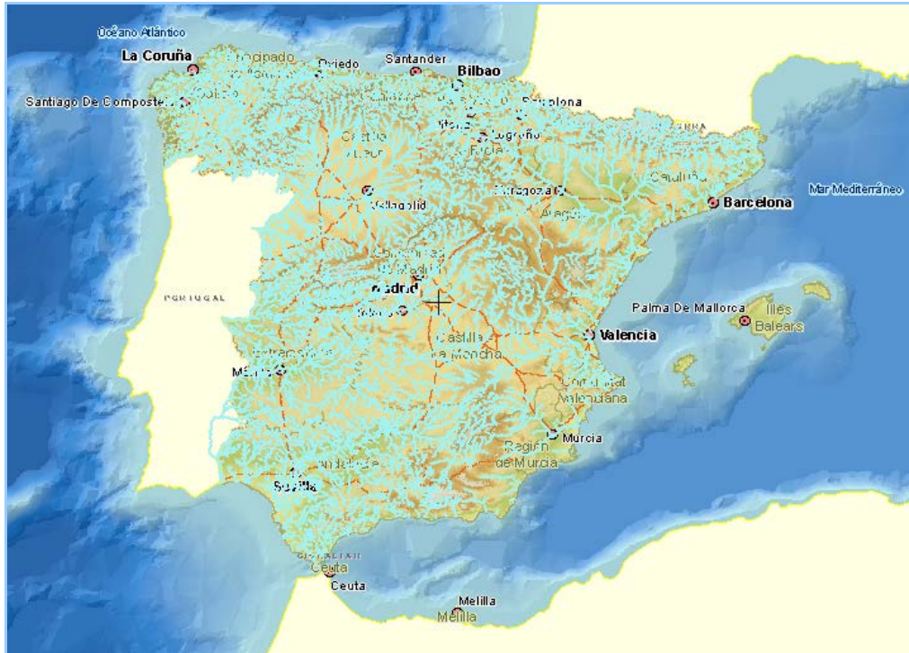
Imagen general del servicio

La información cartográfica que se puede visualizar en este servicio es la siguiente: