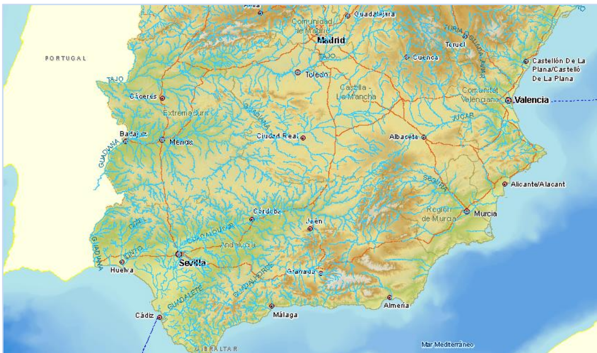
Imagen general del servicio

La información cartográfica que se puede visualizar en este servicio es la siguiente: