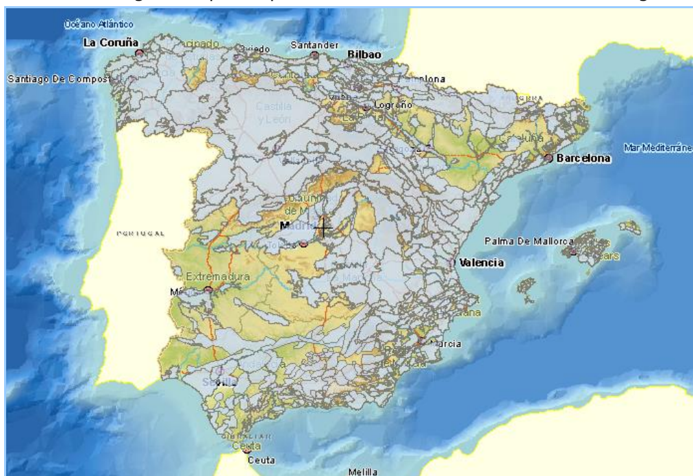
Imagen general del servicio

La información cartográfica que se puede visualizar en este servicio es la siguiente: