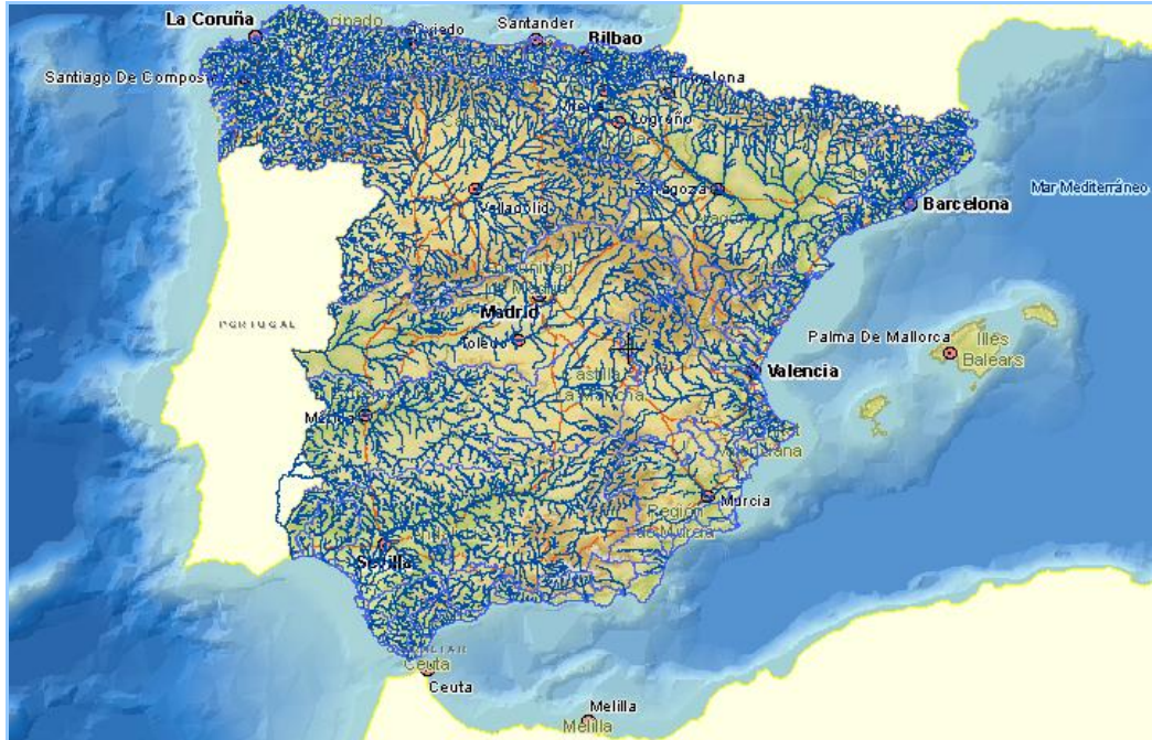
Imagen general del servicio

La información cartográfica que se puede visualizar en este servicio es la siguiente: