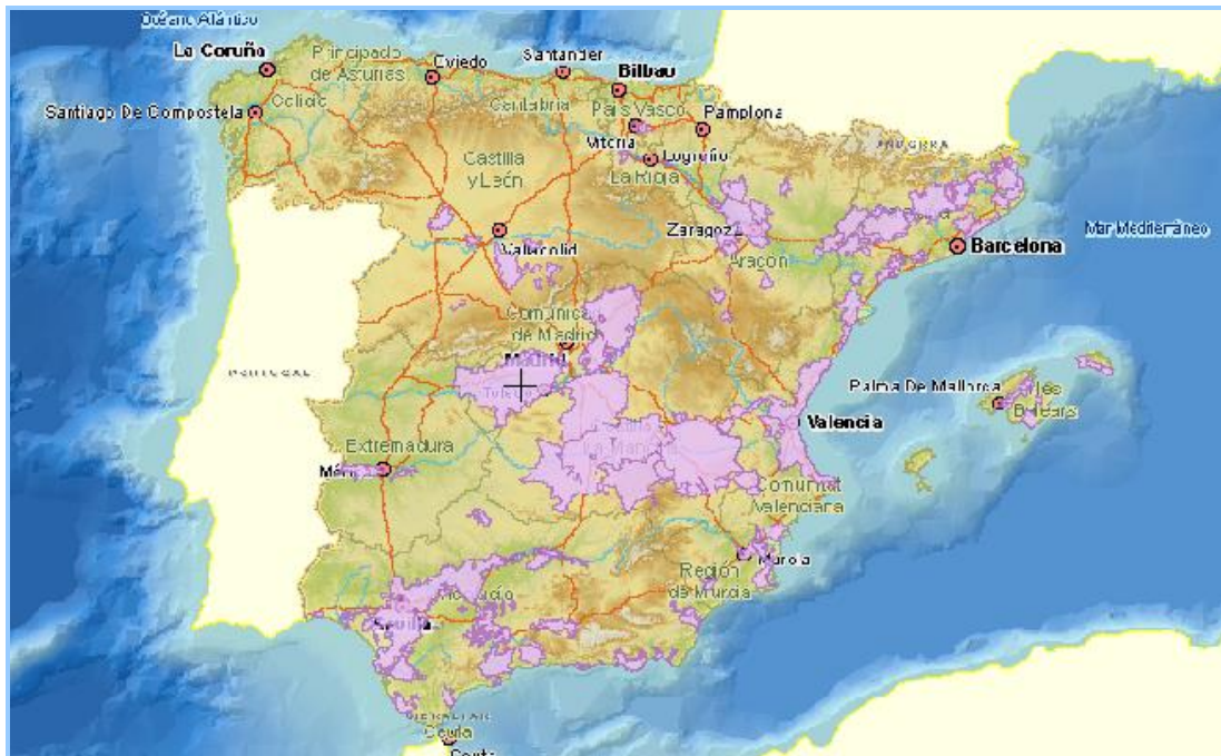
Imagen general del servicio

La información cartográfica que se puede visualizar en este servicio es la siguiente: