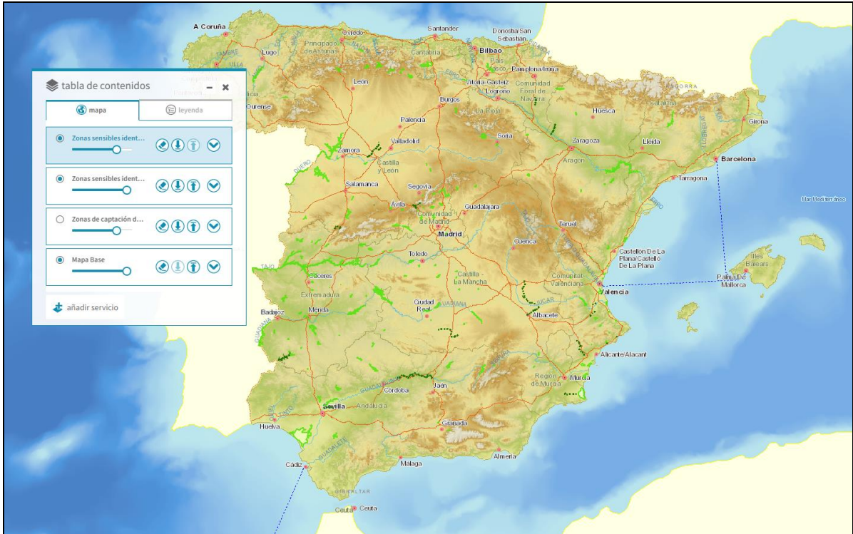
Imagen general del servicio

La información cartográfica que se puede visualizar en este servicio es la siguiente: