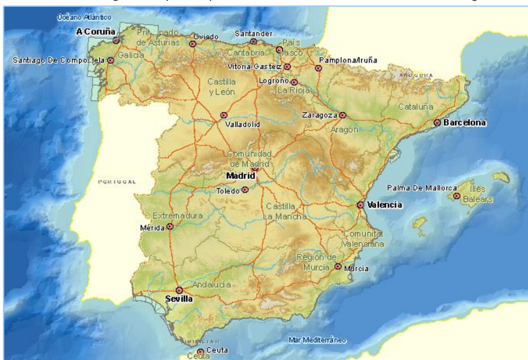
Imagen general del servicio

La información cartográfica que se puede visualizar en este servicio es la siguiente: