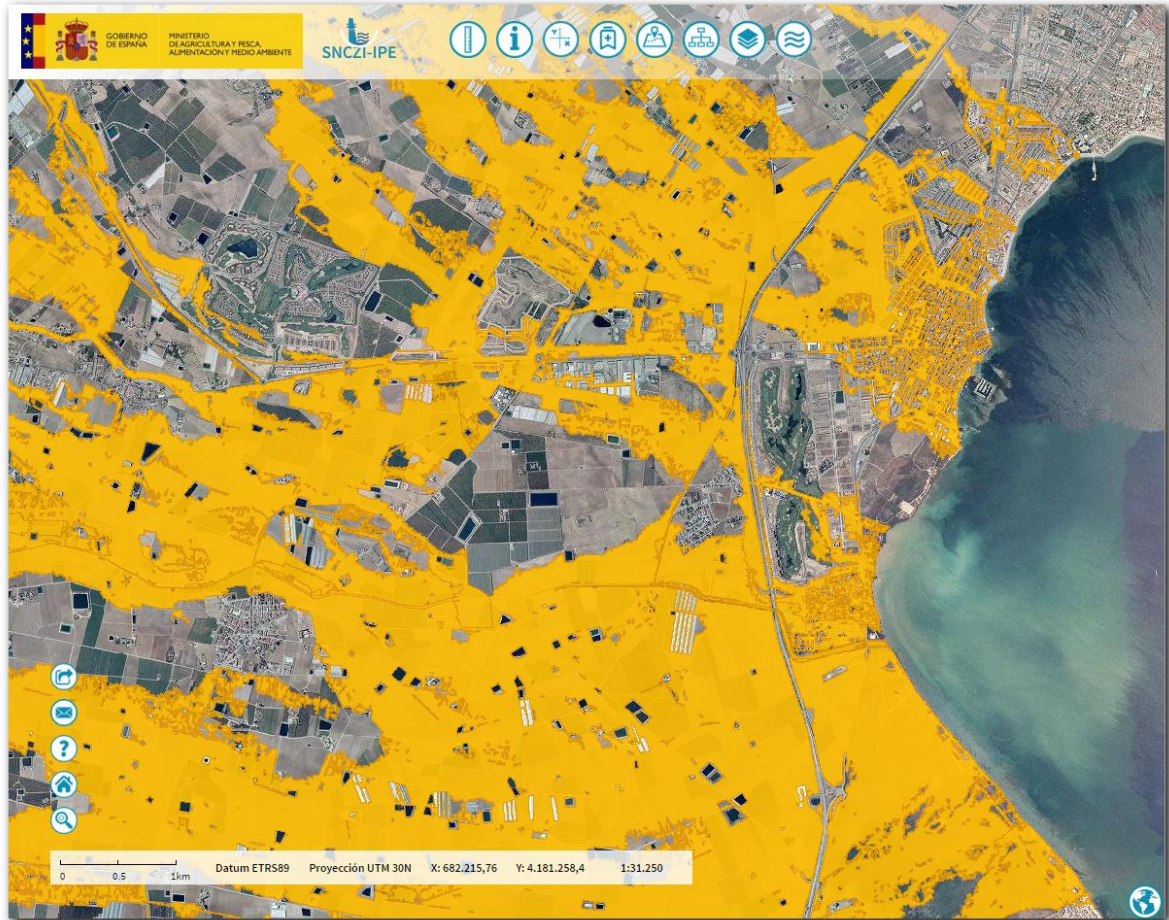
Imagen de detalle de la información del servicio