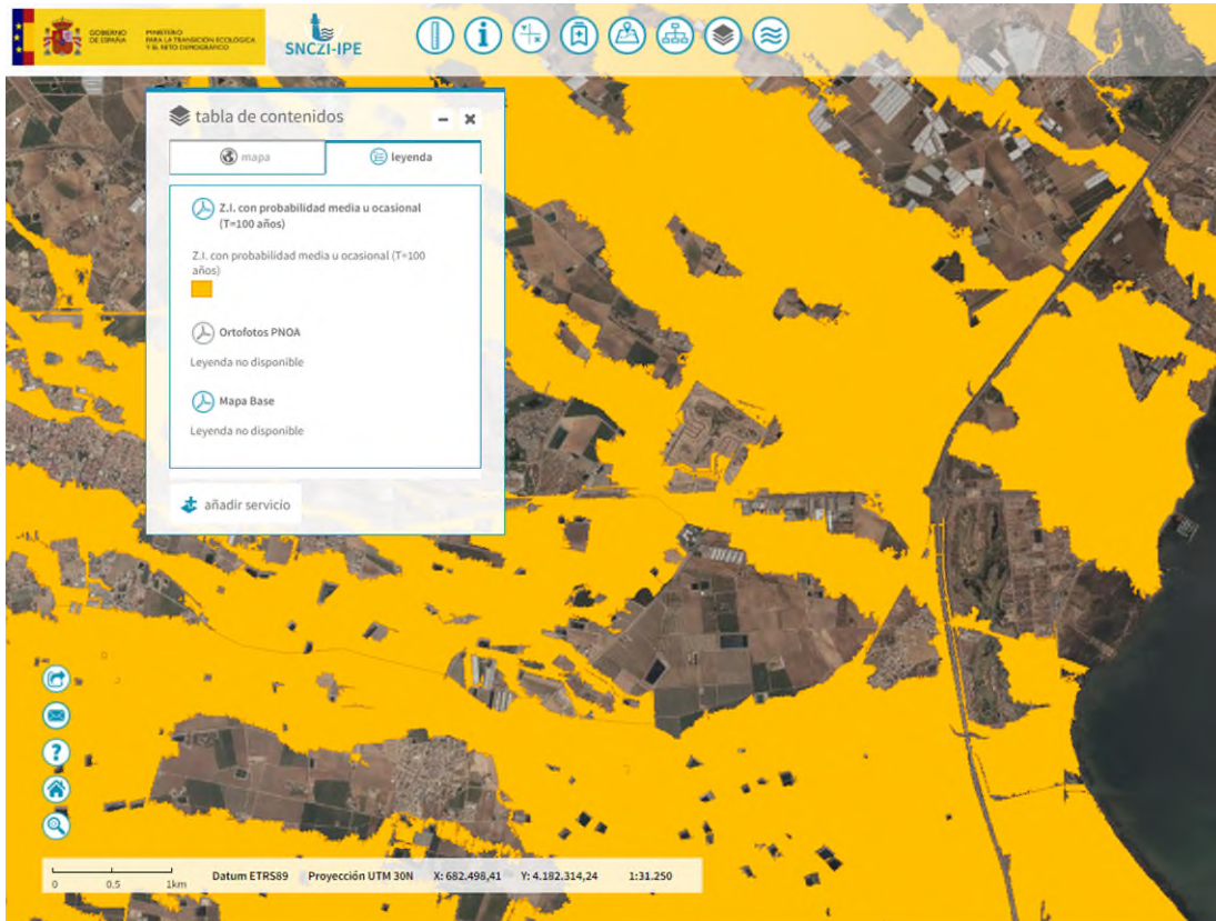
Imagen de detalle de la información del servicio