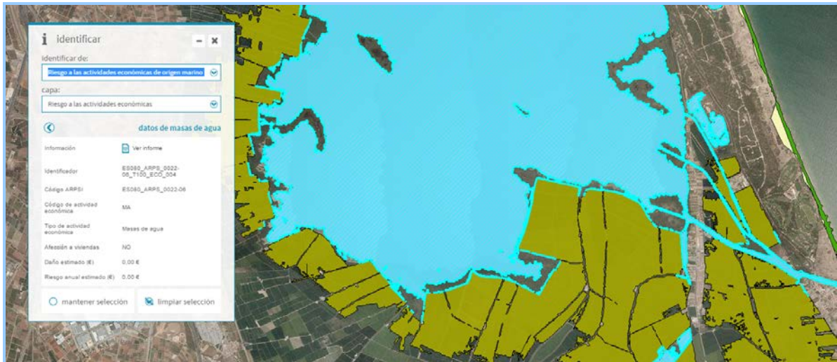
Imagen de detalle de la información del servicio en las proximidades de Valencia