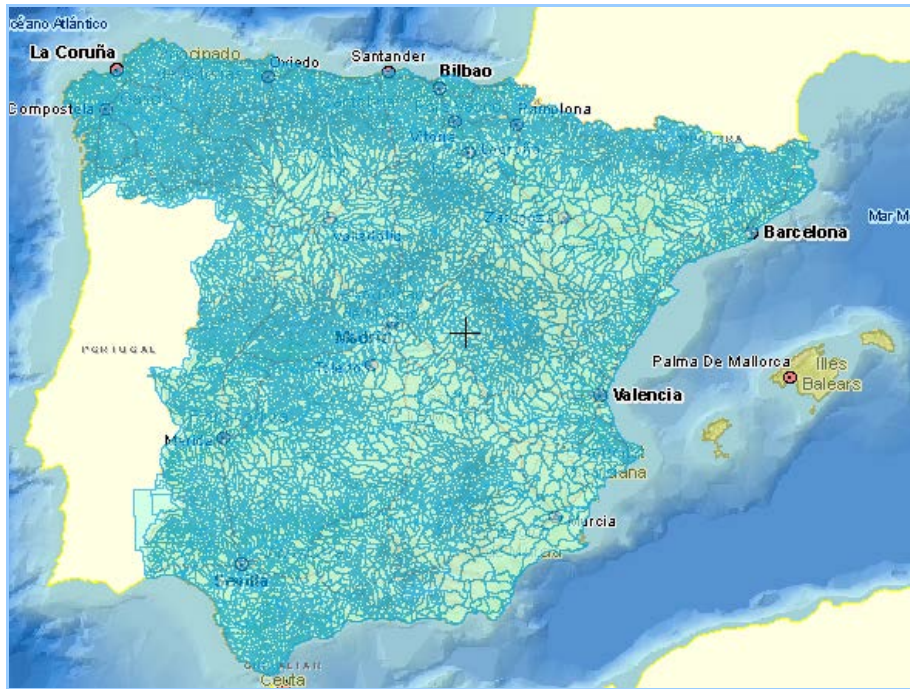
Imagen general del servicio

La información cartográfica que se puede visualizar en este servicio es la siguiente: