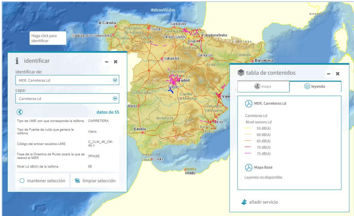
Imagen general del servicio. Carreteras. Ld