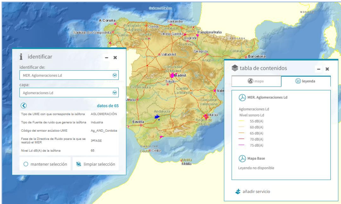
Imagen general del servicio. Aglomeraciones. Ld