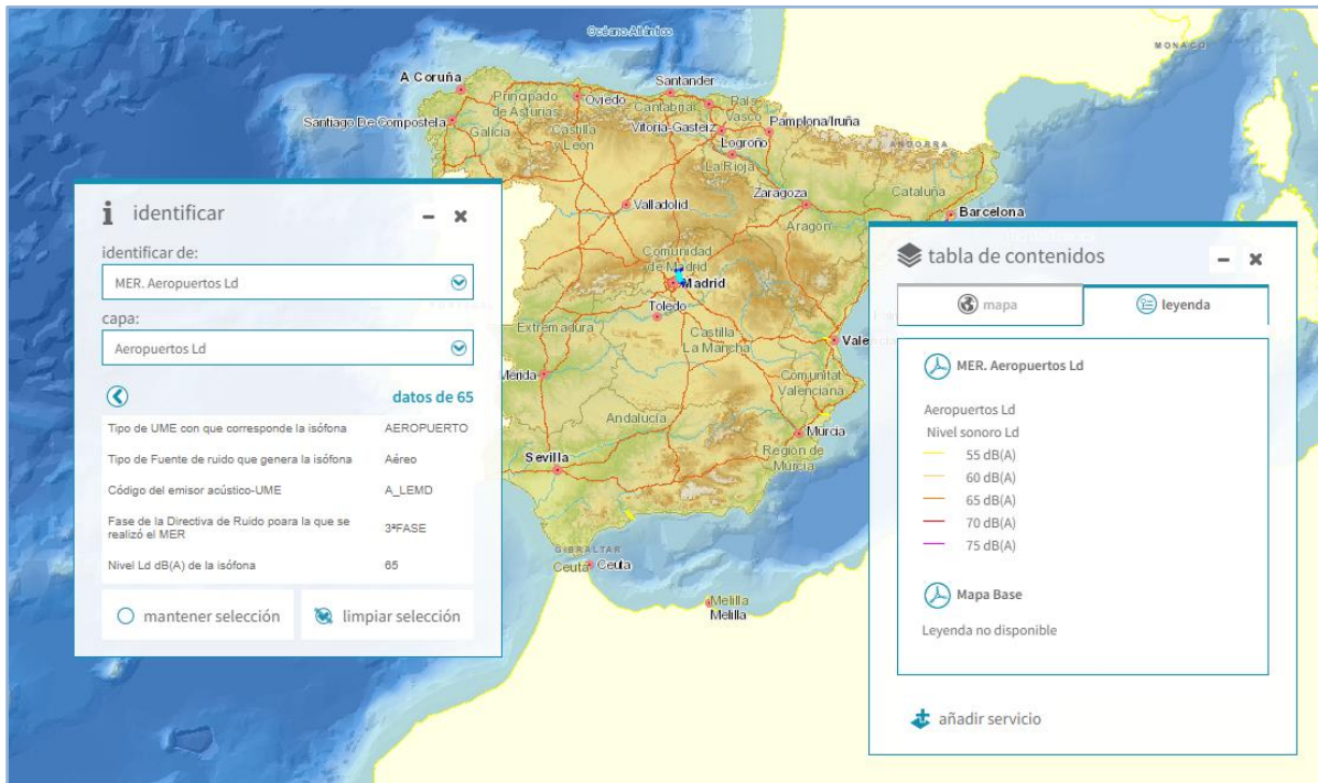
Imagen general del servicio. Aeropuertos. Ld

La información cartográfica que se puede visualizar en este servicio es la siguiente: