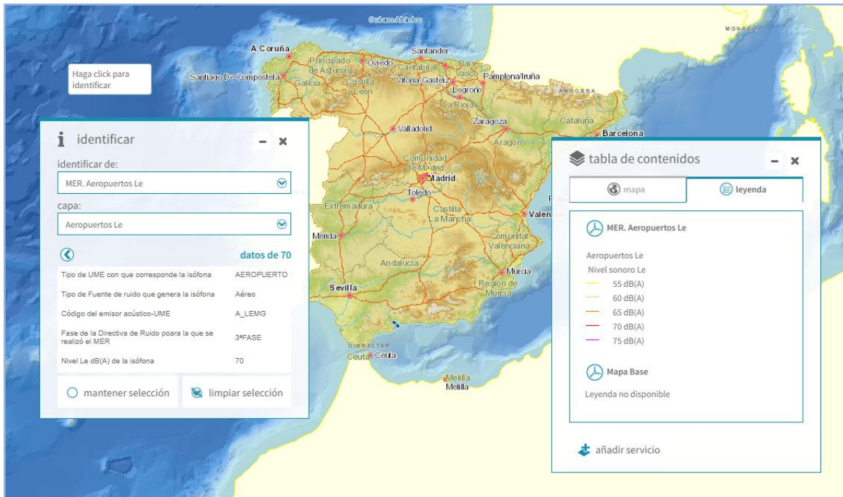
Imagen general del servicio. Aeropuertos. Le

La información cartográfica que se puede visualizar en este servicio es la siguiente: