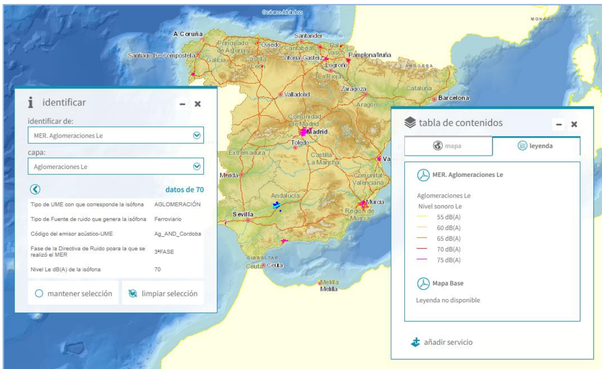
Imagen general del servicio. Aglomeraciones. Le