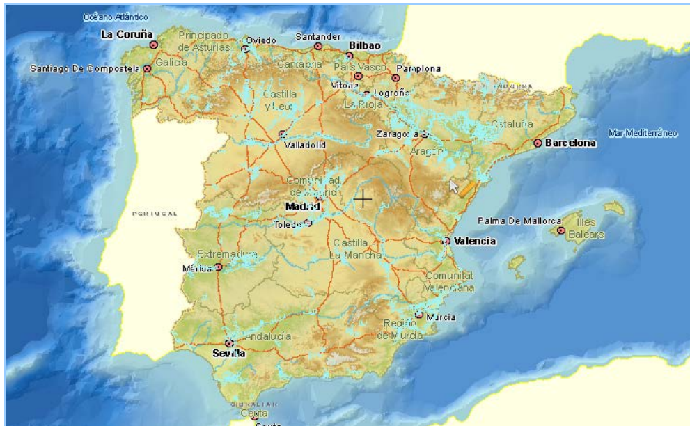
Imagen general del servicio

La información cartográfica que se puede visualizar en este servicio es la siguiente: