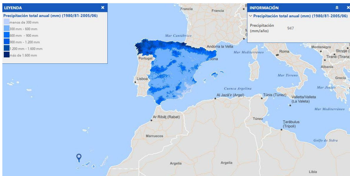
Imagen del servicio

La información cartográfica que se puede visualizar en este servicio es la siguiente: