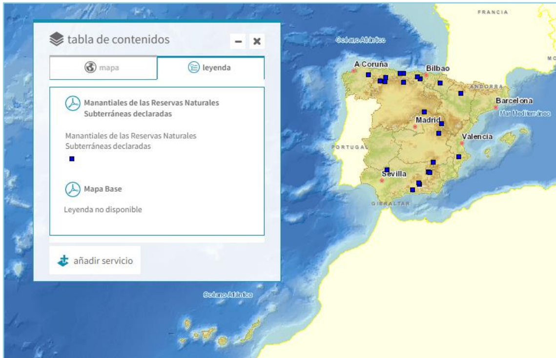
Imagen general del servicio

La información cartográfica que se puede visualizar en este servicio es la siguiente: