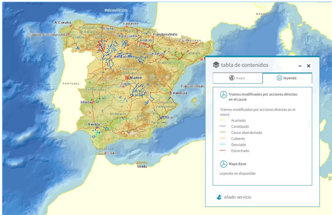
Imagen general del servicio

La información cartográfica que se puede visualizar en este servicio es la siguiente: