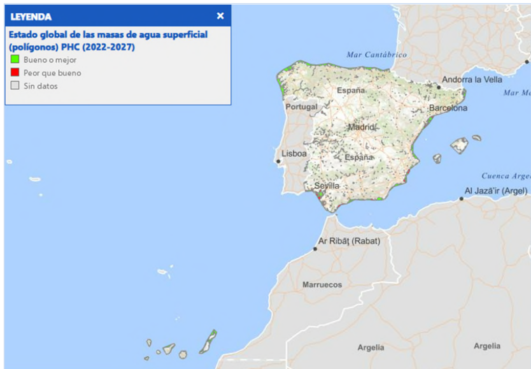
Imagen general del servicio (Polígonos)