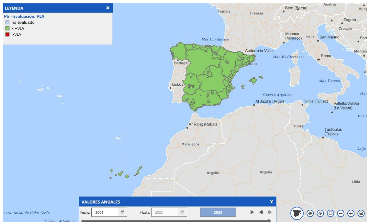
Imagen general del servicio

La información cartográfica que se puede visualizar en este servicio es la siguiente: