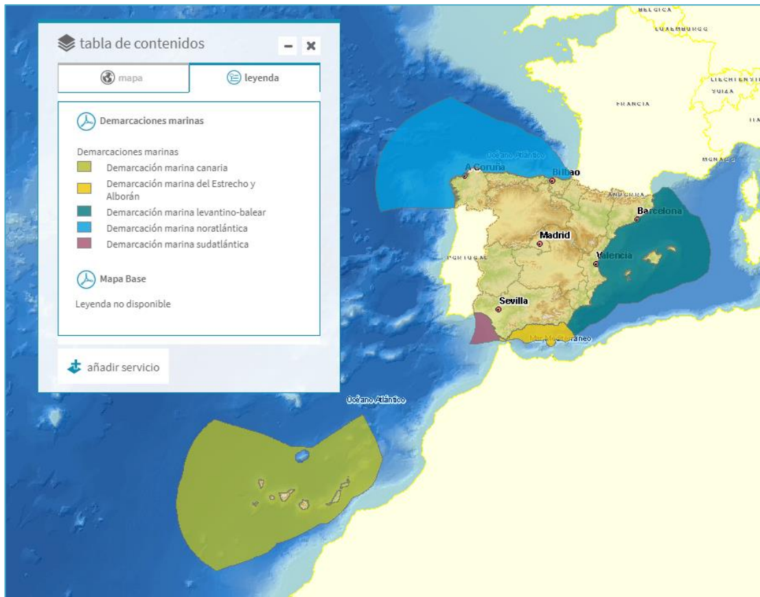
Imagen general del servicio (delimitación de las demarcaciones marinas)

La información cartográfica que se puede visualizar en este servicio es la siguiente: