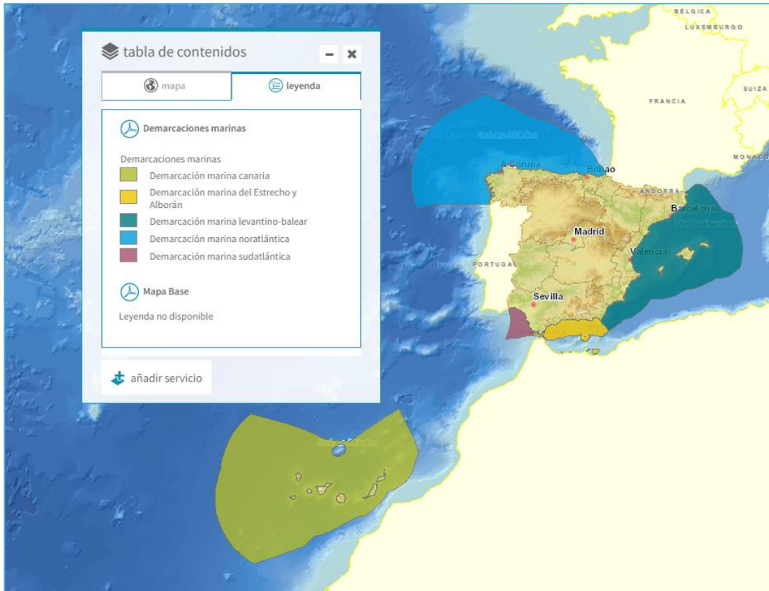
Imagen general del servicio (delimitación de las demarcaciones marinas)

La información cartográfica que se puede visualizar en este servicio es la siguiente: