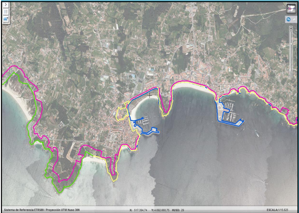
Imagen de detalle de la información del servicio