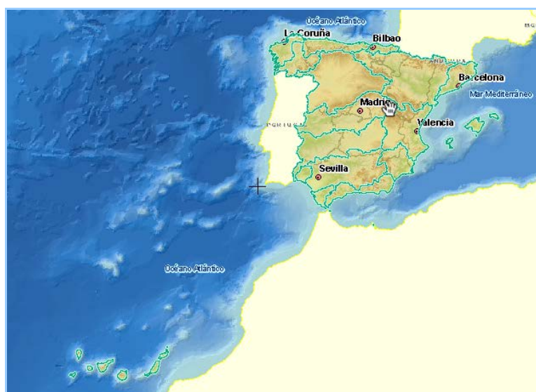
Imagen general del servicio

La información cartográfica que se puede visualizar en este servicio es la siguiente: