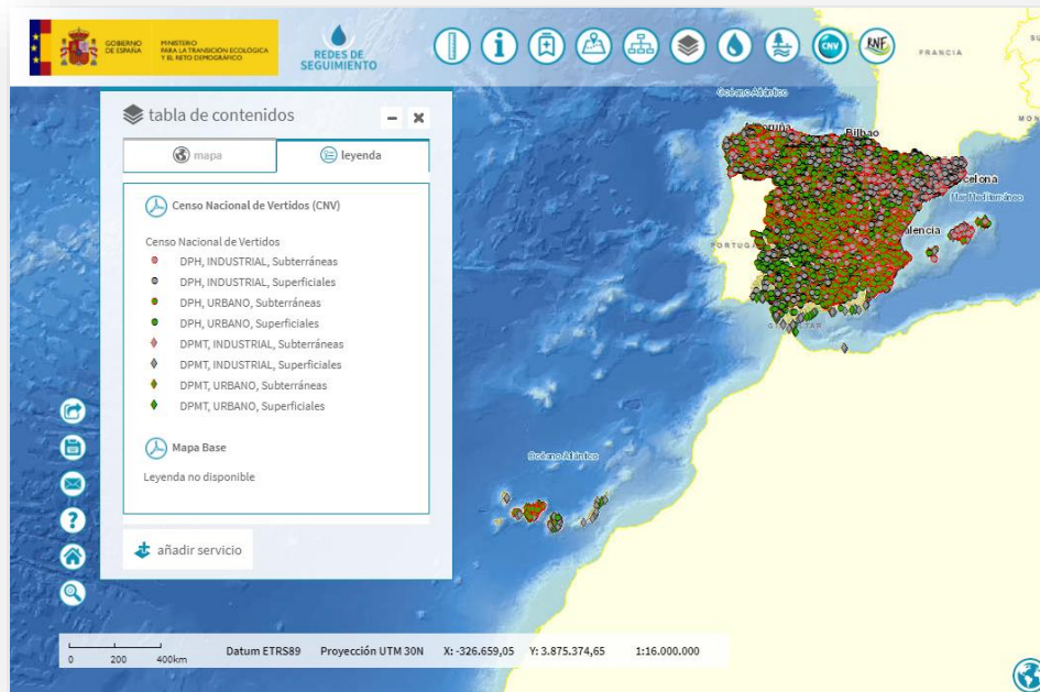
Imagen general del servicio

La información cartográfica que se puede visualizar en este servicio es la siguiente: