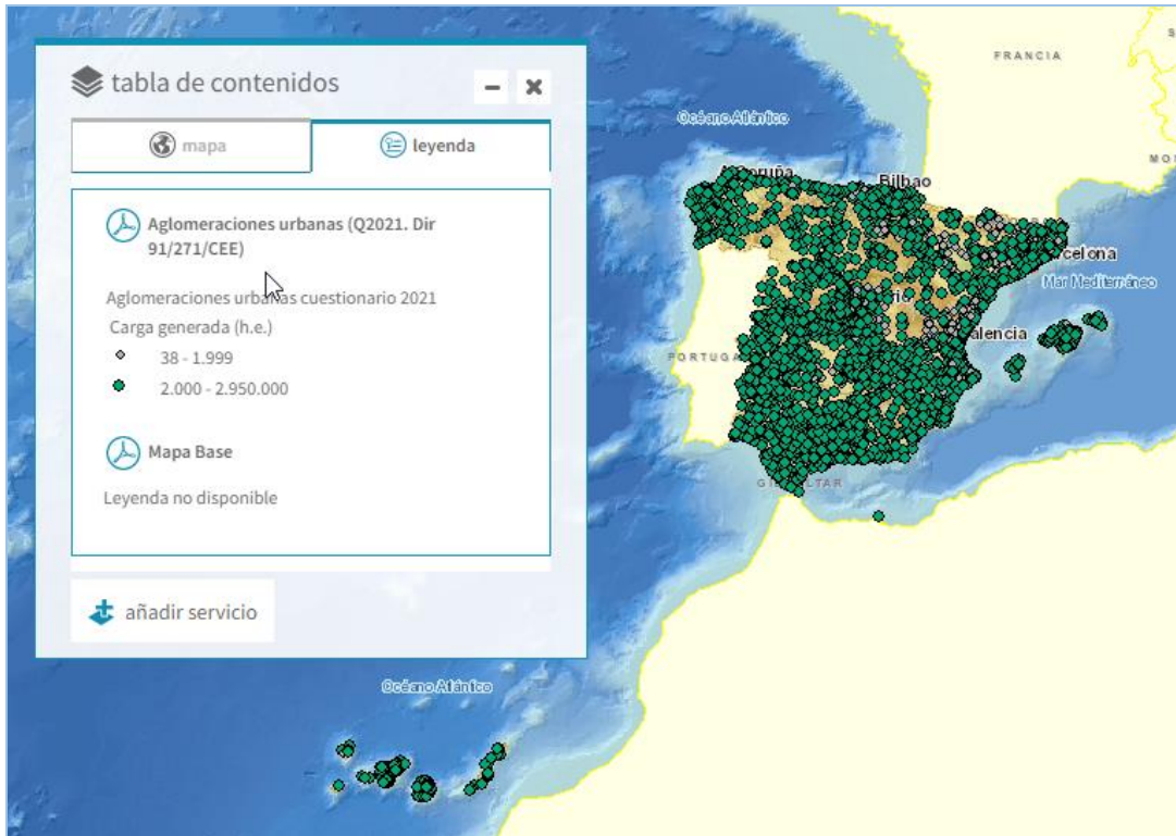
Imagen general del servicio

La información cartográfica que se puede visualizar en este servicio es la siguiente: