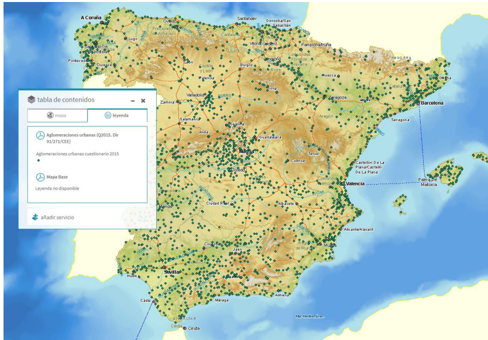
Imagen general del servicio

La información cartográfica que se puede visualizar en este servicio es la siguiente: