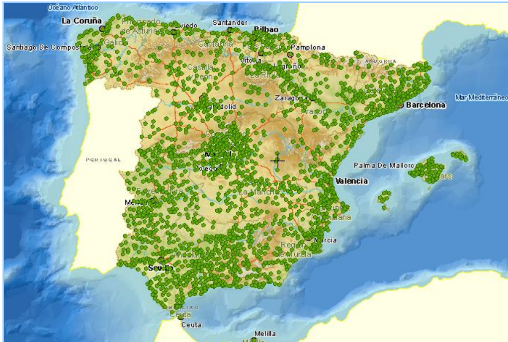
Imagen general del servicio

La información cartográfica que se puede visualizar en este servicio es la siguiente: